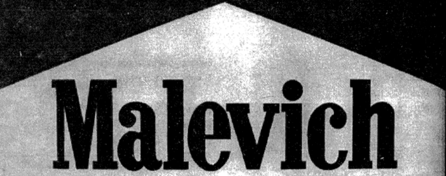
Александр Косолапов. Малевич-Мальборо. 1989. Холст, масло. 120x180.

абстракционизма - картины как "живописания ощущений" (Малевич) и картины как творения форм, которые не должны быть подражанием каким бы то ни было феноменам видимого мира (так уже после войны объяснял смысл абстрактной живописи Роман Ингарден) - Айги ближе визуализация идеи: "живописание" понятий или ощущений средствами поэзии (хотя и ингарденское объяснение целей абстракционизма также находит в поэзии Айги поразительные осуществления). Как картины Малевича, так и лирические видения Айги конституируются между полярными противоположностями: неповторимой одноразовостью конкретного предмета и универсальной неизменностью абстракции. Я имею в виду драму "материи" и "духа", которую так выразительно изобразил Збигнев Херберт в стихотворении "Исследование предмета", содержащим скрытые цитаты и парафразы манифеста Малевича.