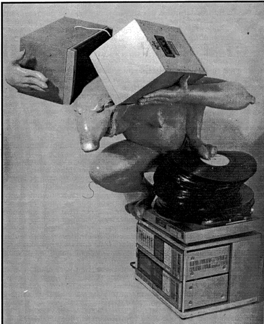
Дэйвид Мах "Старая мелодия", 1992г.