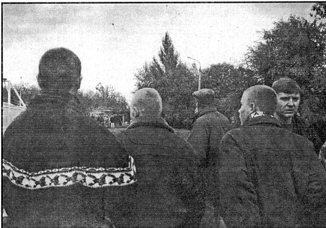
Св.Осьмачкина. Из серии "Жанровые сценки". Самара, октябрь 1996.