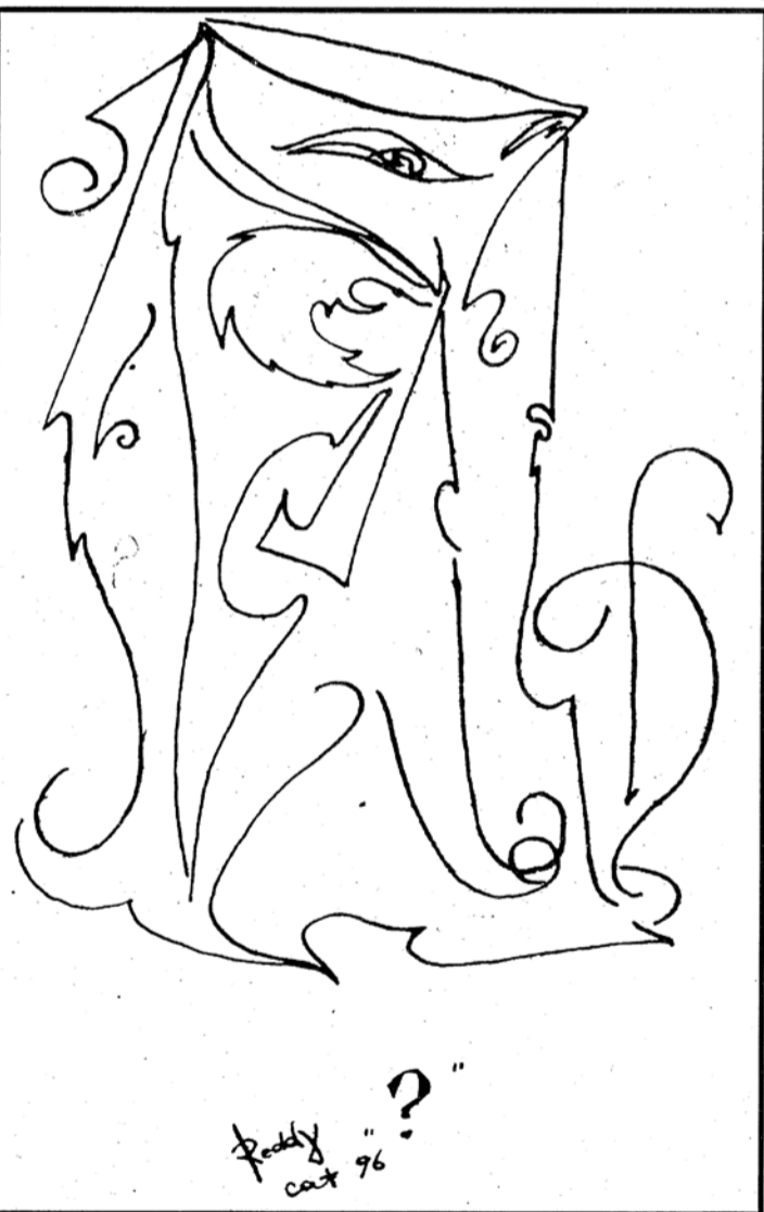
Reddy cat 96 ?

Это рисунки человека, умеющего видеть превращения и