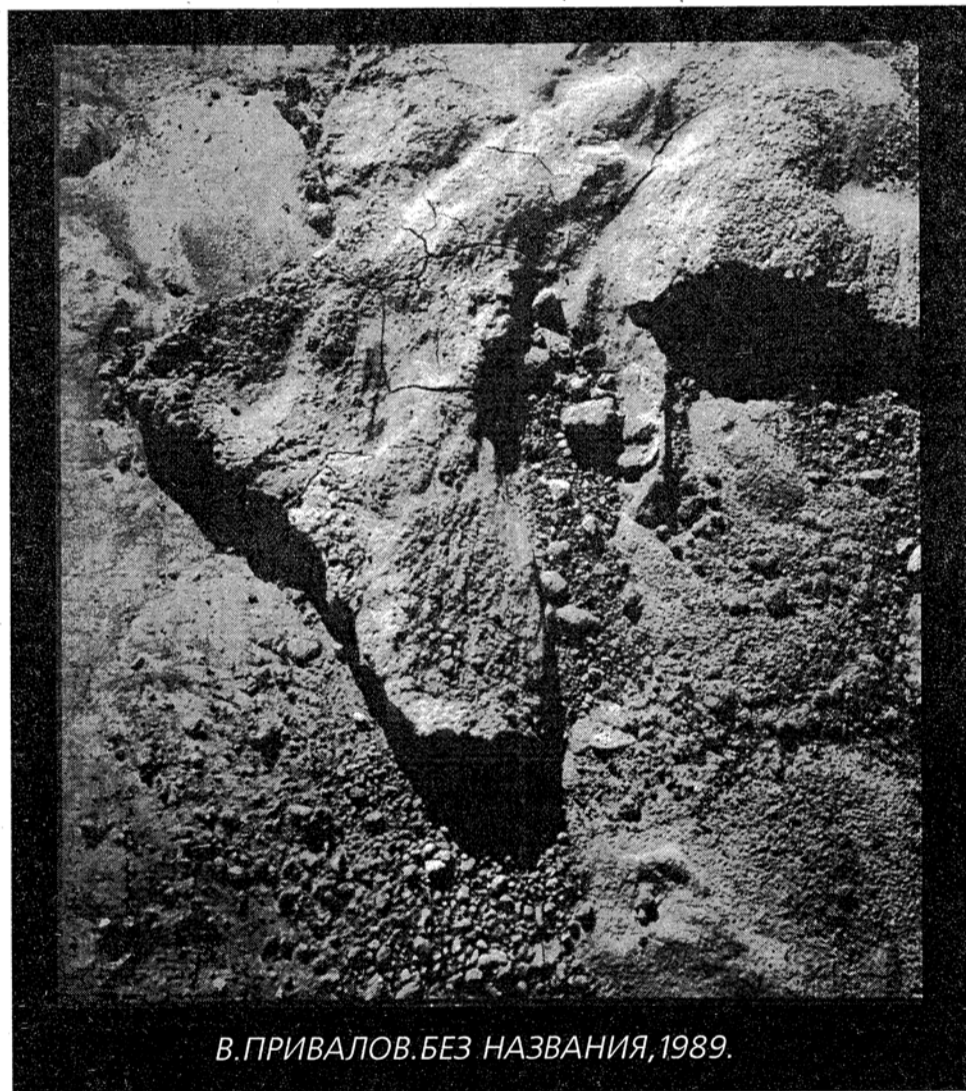
В. ПРИВАЛОВ. БЕЗ НАЗВАНИЯ, 1989.

неизбежно, что рано или поздно должна возникнуть естественная защитная реакция.