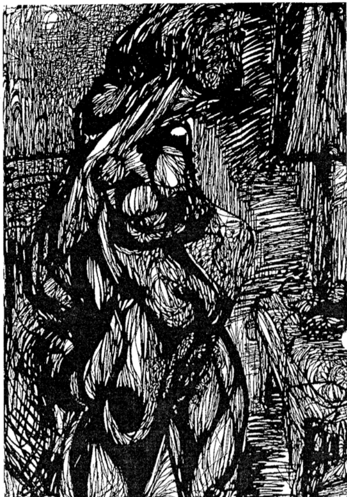
В.Батьянов. Одиночество. Жажда страсти, 1990.

"зазоры", которые образует бесконечно пересекающаяся сама с собой вибрирующая линия его штриха, ткущая на наших глазах некое миражно-волнующее зрелище. Что это? Закодированная карта подсознания художника, воплощение ячеистой структуры мирового пространства, в котором все, рождаясь из ничего, уходит в ничто; съемка со спутника, передающая сеть земных коммуникаций, либо же визионерский мираж "серебряного века", времен Борисова-Мусатова и Врубеля, Сапунова и Милиоти?